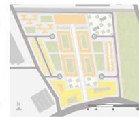
PLANO DE PARCELAS