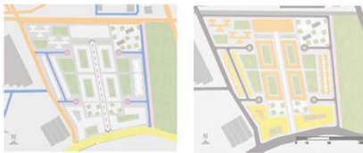
PLANO DE VÍAS

Para la implementación de las vías se basó primero al punto, por lo que se implementó una alameda en el eje central con equipamiento comercial y social. La vía vehicular y para ciclistas se diseñó pensando en un acceso directo a las viviendas y al resto de equipamientos. Esta vía además, debida sea la más corta posible para así evitar atravesar el terreno en su totalidad.